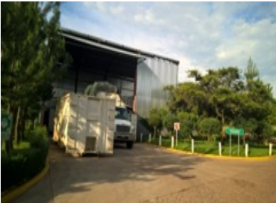
Vista de la transferencia febrero 2017

La Constitución Política de los Estados Unidos Mexicanos, en su artículo 115, establece que los municipios, previo acuerdo entre sus Ayuntamientos, podrán coordinarse y asociarse para la más eficaz prestación de los servicios o el mejor ejercicio de las funciones que le correspondan.